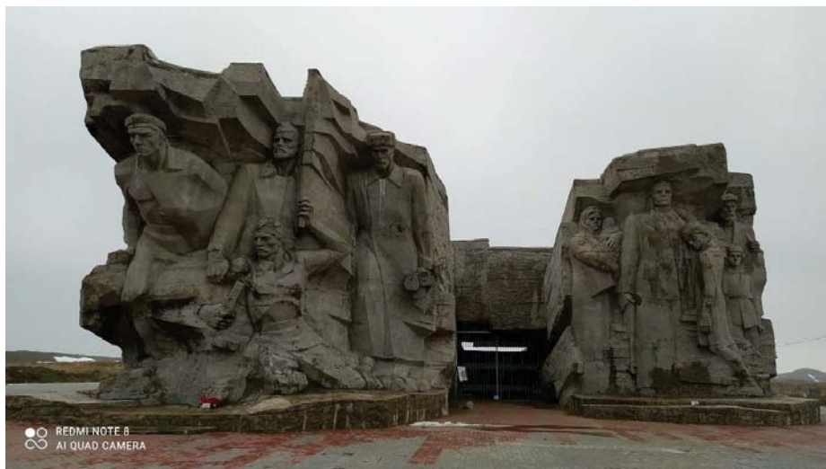
Мемориальный комплекс «Аджимушкай».

прожить в уважении к тем, кому стольким обязан. Мы не дадим переписать историю, и, как и прежде, «за ценой не постоим».