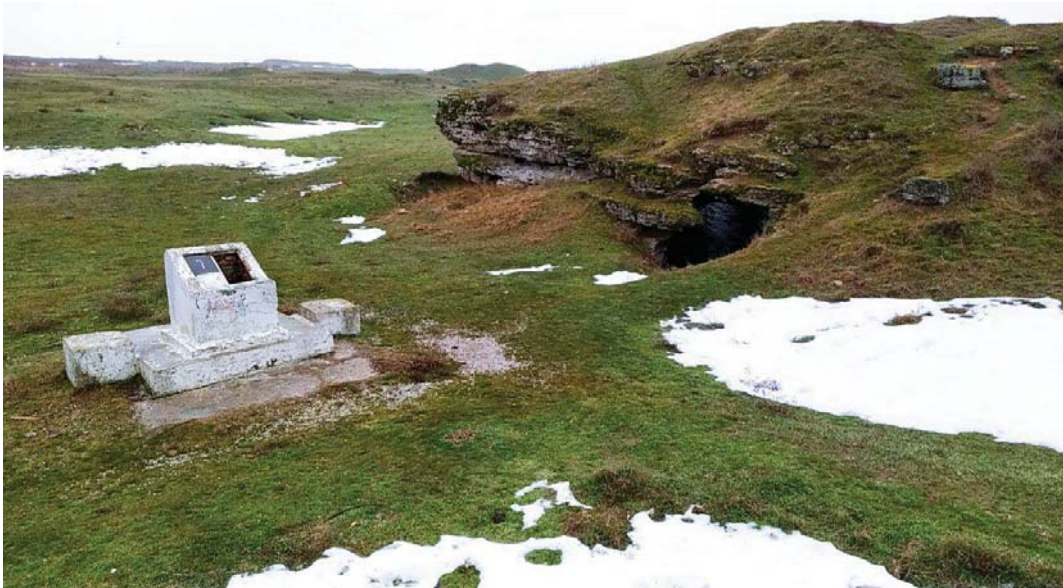
Колодец у Аджимушкайских каменоломен.