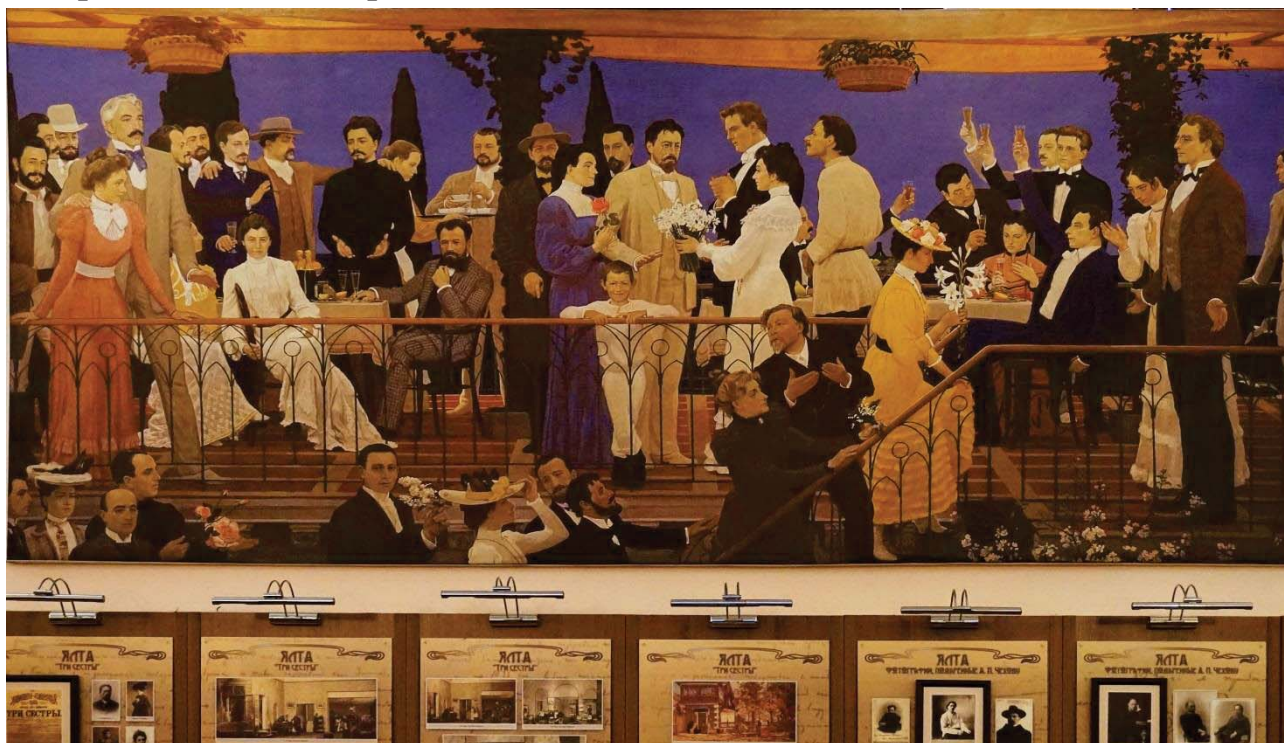
Д. Жилинский. Весна Художественного театра (Авторская репродукция). Холст, темпера. 160×350. Дом-музей А. П. Чехова в Ялте.

поражая как тревогой и драматизмом, так и чувственностью и экспрессией сопереживающего современности человека.