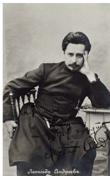
Фотографии Леонида Андреева начала 1900-х гг.