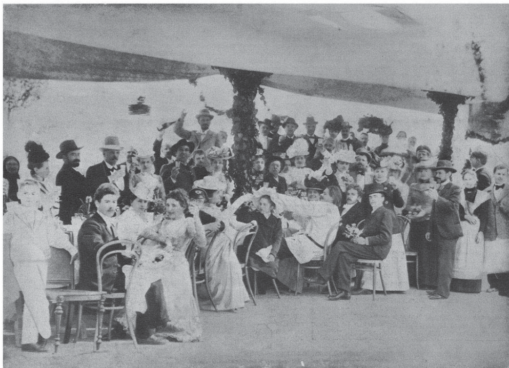
Приём, устроенный Ф. К. Татариновой в честь МХТ. Ялта, 1900.

К. С. Станиславский, И. А. Бунин [2], О. Л. Книппер-Чехова [5] вспоминали чудесный завтрак-„феерию“ на громадной плоской крыше виллы Татариновых, которым театр закончил свои крымские гастроли.