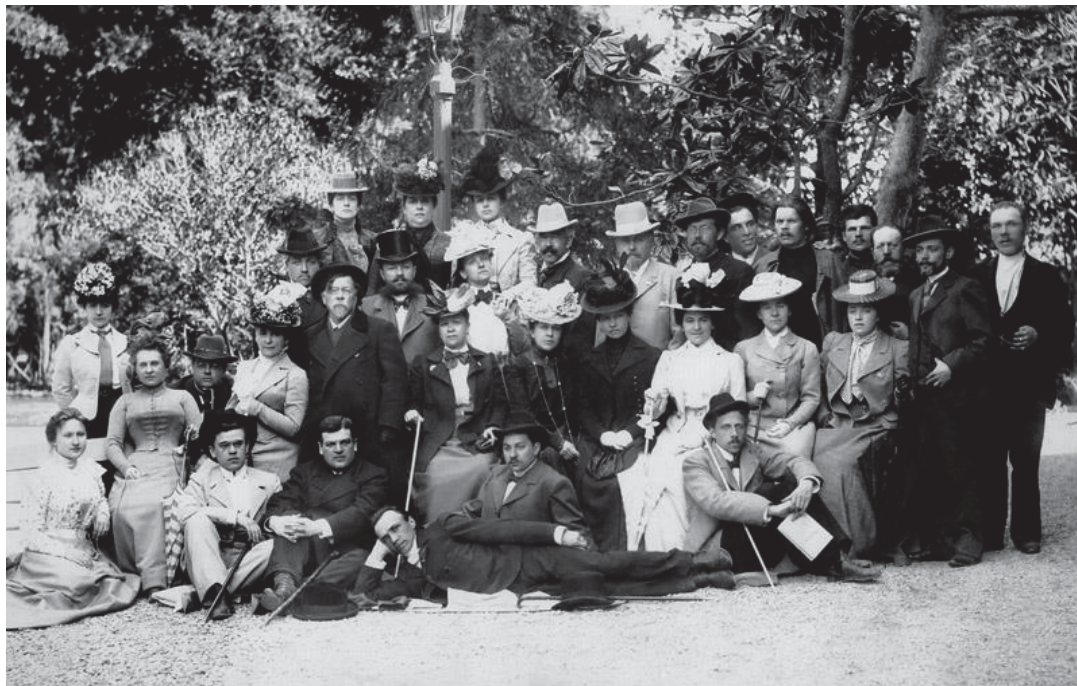
Актёры МХТ с Антоном Чеховым и Максимом Горьким в Ялте. 1900.

К. С. Станиславский, И. А. Бунин [2], О. Л. Книппер-Чехова [5] вспоминали чудесный завтрак-„феерию“ на громадной плоской крыше виллы Татариновых, которым театр закончил свои крымские гастроли.