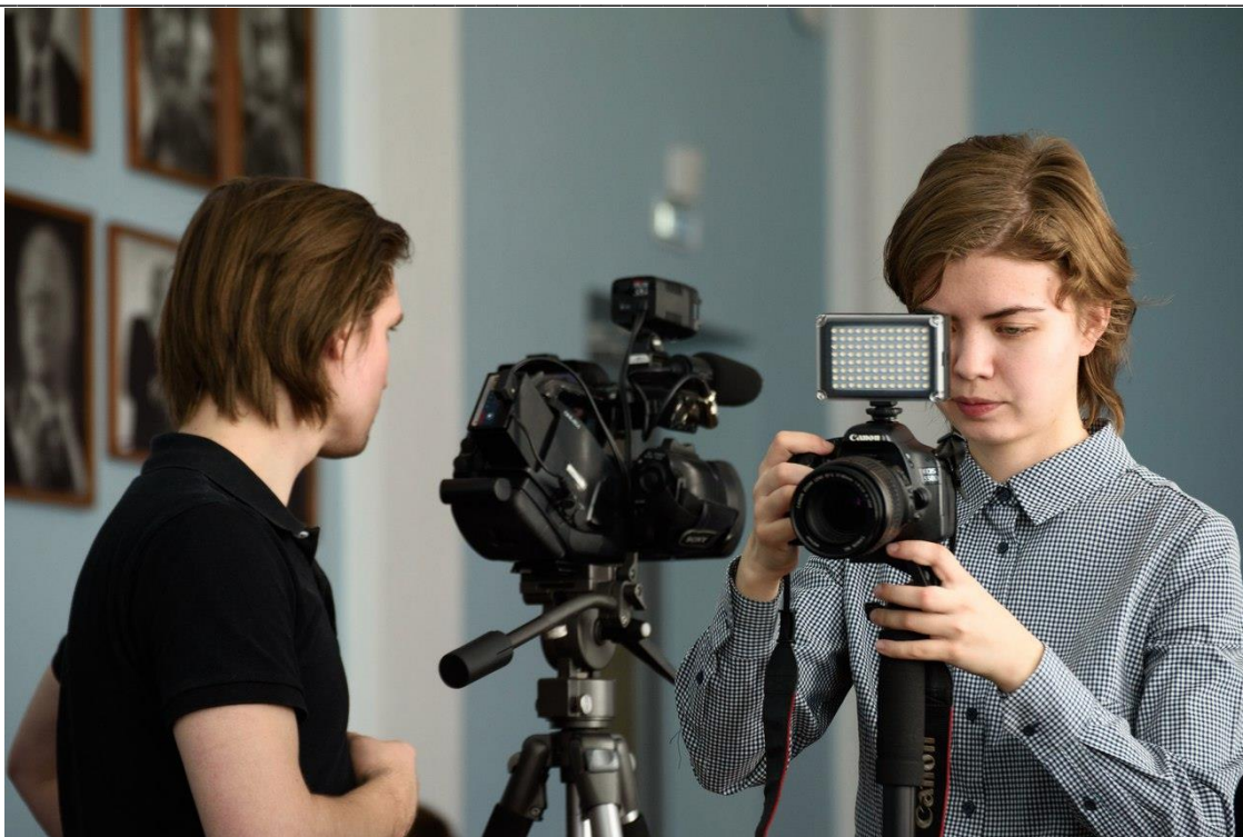
Студенты кафедры «Журналистика и массовые коммуникации» на телевизионной съёмке

опыт работы группы студентов в структурном подразделении Южно-Уральского государственного университета «360-градусный мультимедийный ньюсрум ЮУрГУ»: в их докладе получила отражение история создания мультимедийного лонгрида «Русский язык и образование на русском», занявшего 1-е место в Конкурсе на лучший медиацентр среди вузов России.