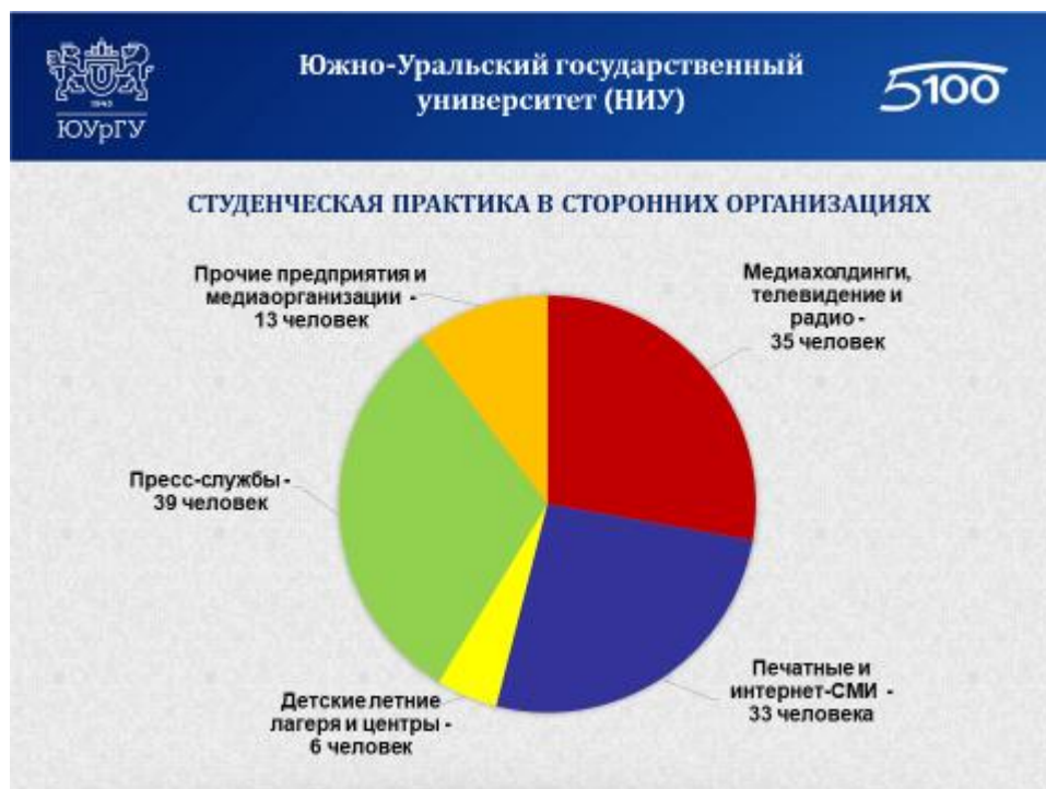
Рисунок 2. Организация практики на базе сторонних организаций (данные за 2016–2017 учебный год)

России», ГБУЗ «Челябинская областная клиническая наркологическая больница»), а также другие медиаструктуры. Количественный аспект распределения практикантов в сторонних организациях представлен на рис. 2.